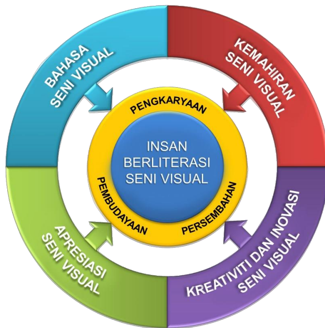
Rajah 2: Model KSSR Pendidikan Seni Visual

Kurikulum Pendidikan Seni Visual (Suaian) memberi fokus kepada pengalaman pembelajaran, pembinaan pemahaman konsep dan peningkatan kemahiran kognitif dan motor halus MBK menerusi aktiviti pengkaryaan, persembahan dan pembudayaan seni. Bagi mencapai hasrat ini, KSSR Pendidikan Seni Visual digubal dengan berasaskan empat modul kurikulum seperti di Rajah 2.