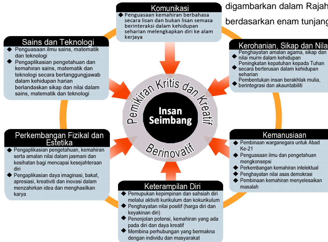
Rajah 1: Kerangka Kurikulum Standard Sekolah Menengah

Enam tunjang tersebut merupakan domain utama yang menyokong antara satu sama lain dan disepadukan dengan pemikiran kritis, kreatif dan inovatif. Kesepaduan ini bertujuan membangunkan modal insan yang menghayati nilai-nilai murni berteraskan keagamaan, berpengetahuan, berketerampilan, berfikir kritis dan kreatif serta inovatif sebagaimana yang digambarkan dalam Rajah1. Kurikulum MPEI Perniagaan digubal berdasarkan enam tunjang Kerangka KSSM.