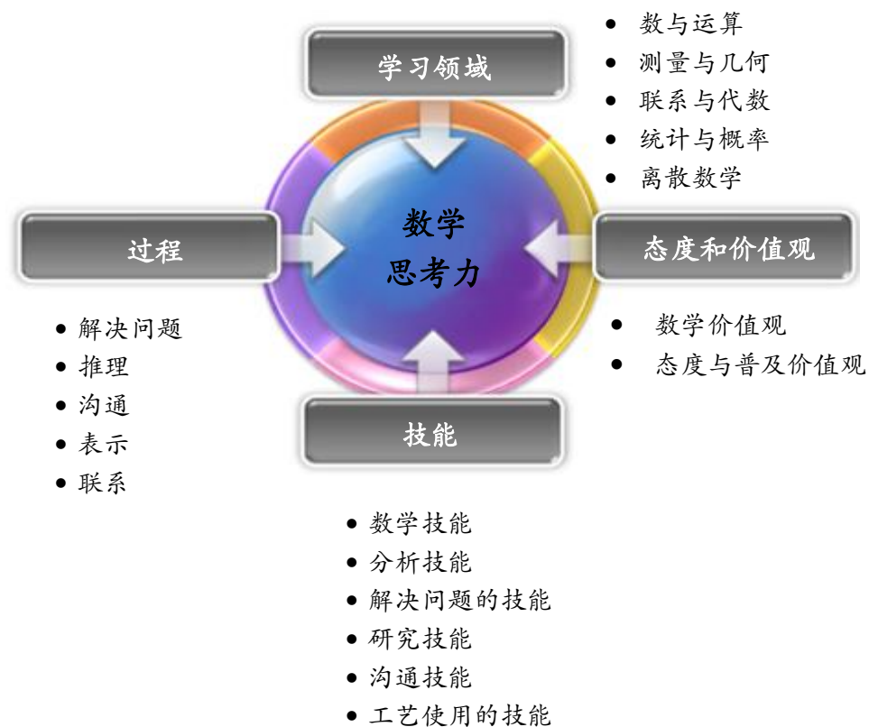
图 2：小学数学课程架构