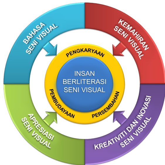
Rajah 2: Model KSSR Pendidikan Seni Visual

KSSR Pendidikan Seni Visual memberi fokus kepada pembinaan insan berliterasi seni menerusi aktiviti pengkaryaan, pengurusan dan pembudayaan seni. Bagi mencapai hasrat ini, KSSR Pendidikan Seni Visual digubal dengan berasaskan empat modul kurikulum seperti di Rajah 2.