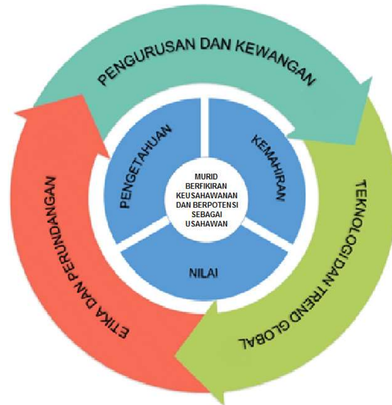
Rajah 2: Kerangka Konsep KSSM PKU

KSSM PKU dapat memenuhi keperluan pendidikan keusahawanan yang seimbang dan holistik dalam usaha melahirkan lebih ramai murid berminda usahawan sebagai landasan melanjutkan pelajaran ke peringkat tertiar. KSSM PKU memberikan penekanan terhadap pembangunan modal insan yang mempunyai profil abad ke-21 untuk menghadapi persaingan industri tempatan dan global. KSSM PKU ini juga menyediakan murid yang berkebolehan dalam menentukan keutamaan dan meningkatkan minat perkembangan teknologi baharu ke arah membudayakan pemikiran keusahawanan dalam pembangunan lestari.