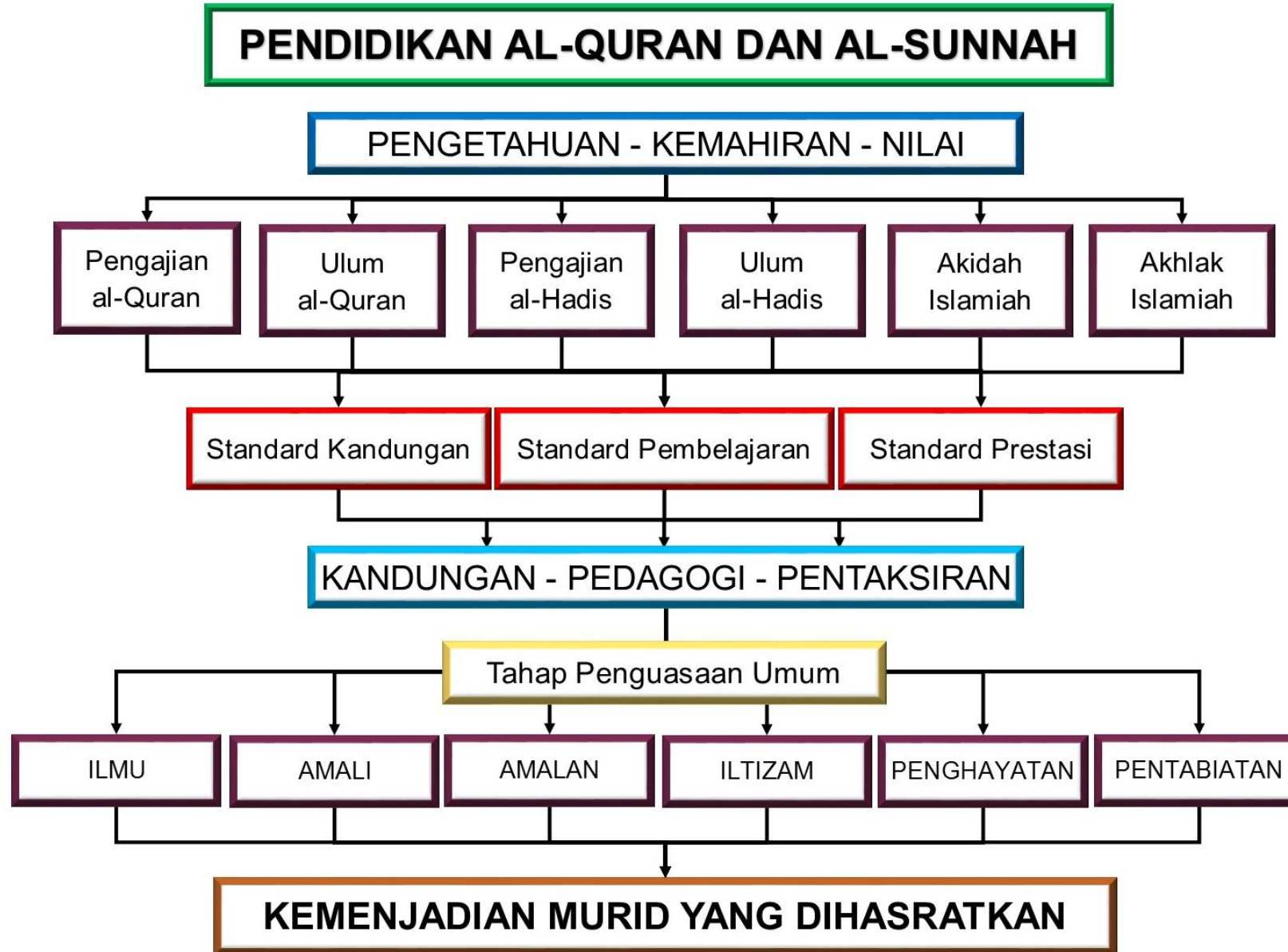
Rajah 3: Organisasi Kandungan KSSM Pendidikan al-Quran dan al-Sunnah