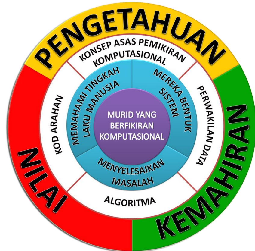
Rajah 2 : Kerangka Konsep Asas Sains Komputer

Pemikiran komputasional ialah kebolehan untuk memahami dan mengaplikasi prinsip asas sains komputer. Melalui pemikiran komputasional, kaedah penyelesaian masalah diterjemah dalam bentuk yang boleh dilaksanakan dengan berkesan menggunakan penyelesaian berteraskan komputer.