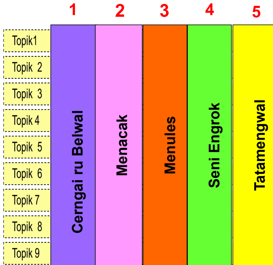
Rajah 3: Sistem Moduler Engrok Semai