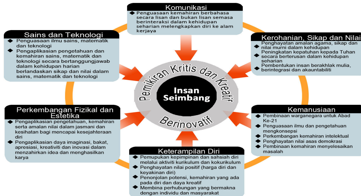
Rajah 1: Kerangka Kurikulum Standard Sekolah Menengah

dan inovatif. Kesepaduan ini bertujuan membangunkan modal insan yang menghayati nilai-nilai murni berteraskan keagamaan, berpengetahuan, berketrampilan, berpemikiran kritis dan kreatif serta inovatif sebagaimana yang digambarkan dalam Rajah 1. Kurikulum Asas Kelestarian digubal berdasarkan enam tunjang kerangka KSSM.