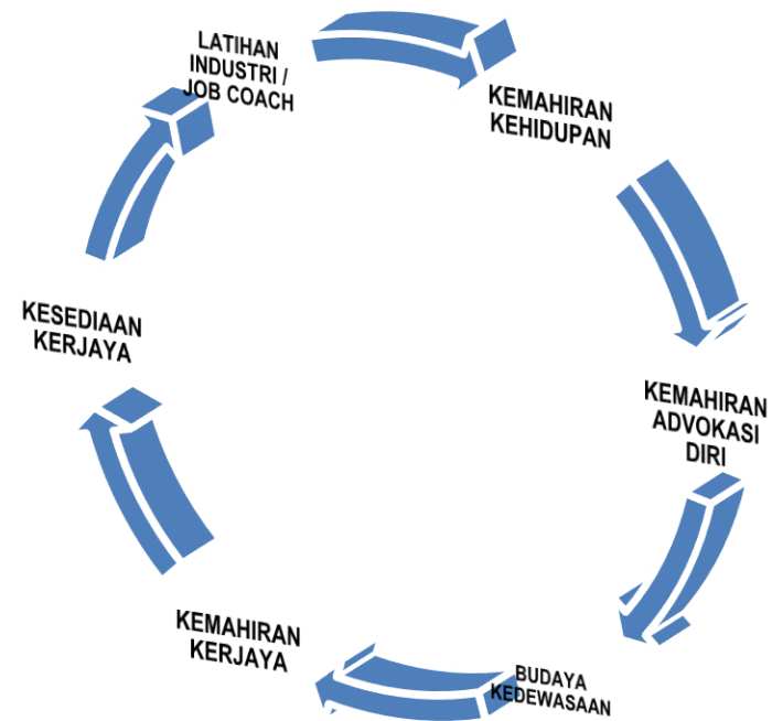
Rajah 1: Kerangka Program Sokongan Transisi ke Kerjaya MBK