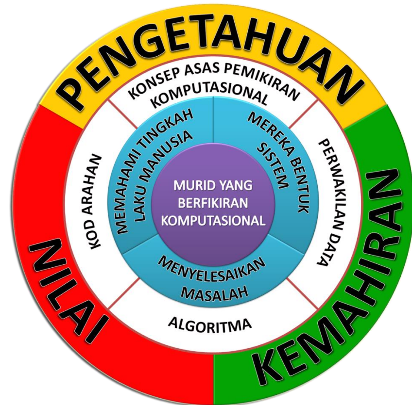
Rajah 2 : Kerangka Konsep Asas Sains Komputer

Pemikiran komputasional ialah kebolehan untuk memahami dan mengaplikasikan prinsip asas sains komputer. Melalui pemikiran komputasional, kaedah penyelesaian masalah diterjemahkan dalam bentuk yang boleh dilaksanakan dengan berkesan menggunakan penyelesaian berteraskan komputer.