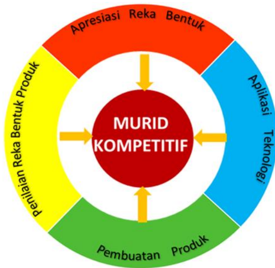
Rajah 2: Domain Reka Bentuk dan Teknologi

KSSM RBT memberi fokus kepada empat domain seperti dalam Rajah 2. Murid akan mengaplikasikan pengetahuan dan kemahiran melalui ktiviti reka bentuk dan penghasilan produk.