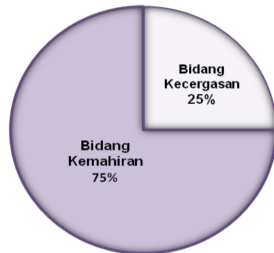
Rajah 2: Pemberatan Bidang Kemahiran dan Bidang Kecergasan dalam Kurikulum Pendidikan Jasmani

Fokus kurikulum Pendidikan Jasmani Tingkatan 3 diterjemahkan dalam Bidang Kemahiran dan Bidang Kecergasan seperti Rajah 2. Kandungan kurikulum ini juga dibahagikan pemberatannya sebanyak 75% Bidang Kemahiran dan 25% Bidang Kecergasan.